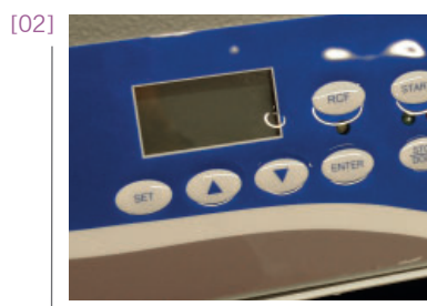
Détail du panel de contrôle