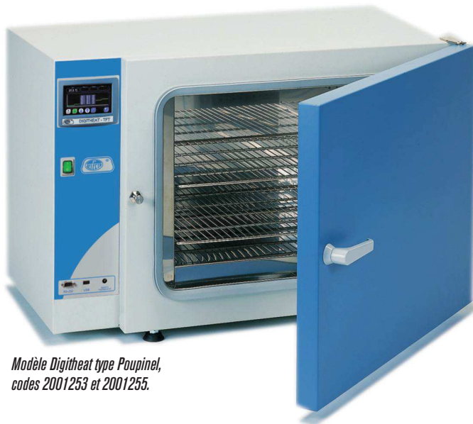
Modèle Digitheat type Poupinel, codes 2001253 et 2001255.