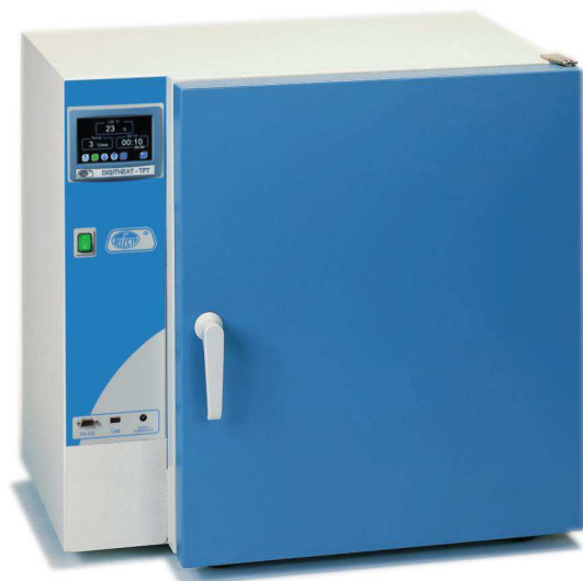
Modèle Digitheat, codes 2001251, 2001252 et 2001254.